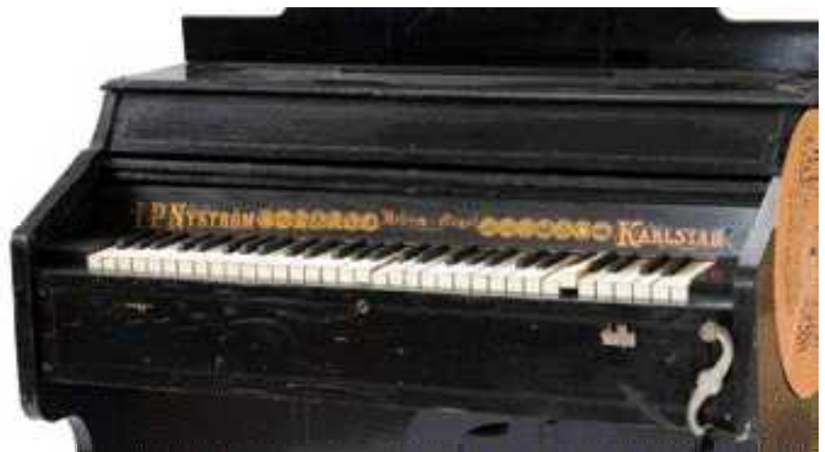
N° 790 détail