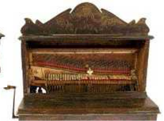
N° 733 détail