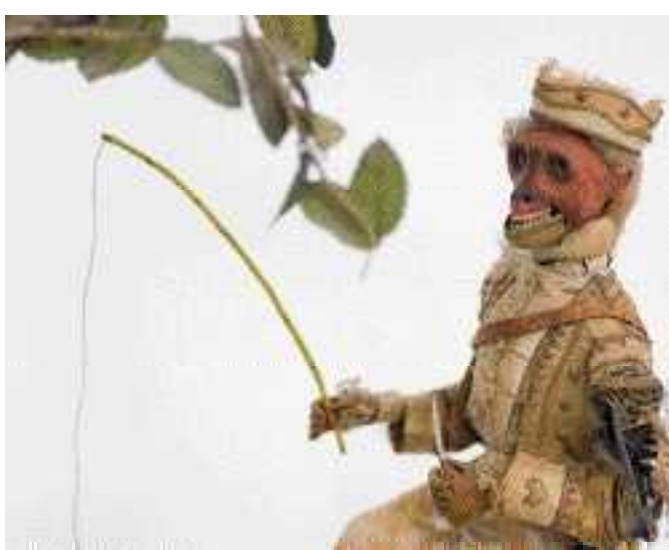
N° 761 détail