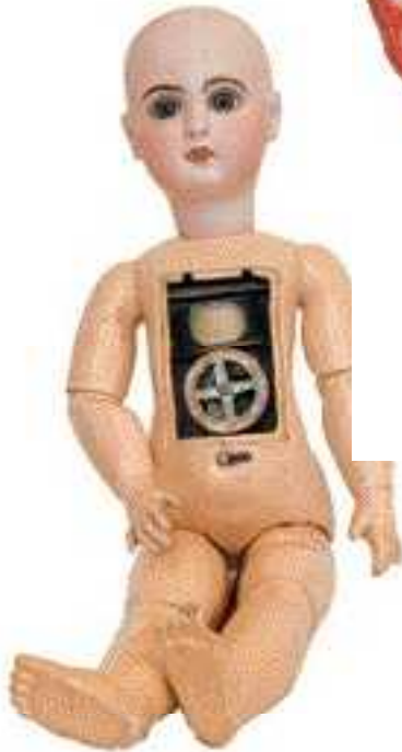
Jumeau - Lioretgraphe N° 547 de la vente du samedi 23 mai.